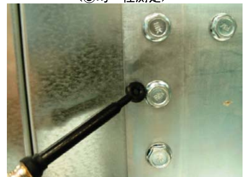
<④シールド測定とサーコイル>

* コンサル料金はサイトの条件などにより異なるため、ご依頼毎にリーズナブルな価格でお見積り致します。