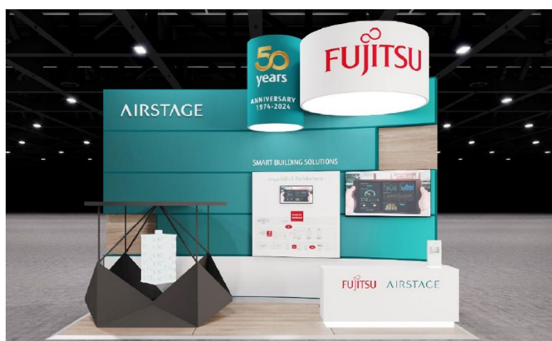
AIRSTAGE ブース (イメージ)