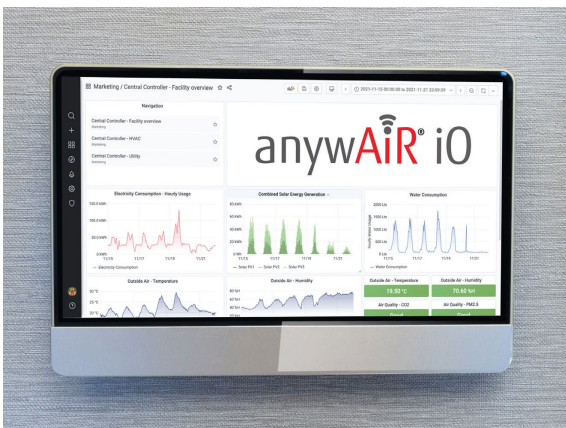
「anywAiR iO」データモニター装置に 運転状況やデータを表示。

※オーストラリアのスマートビルシステムプロバイダーおよび IoT デバイスメーカー