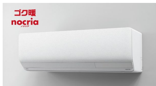
ゴク暖 ノクリア ZN シリーズ