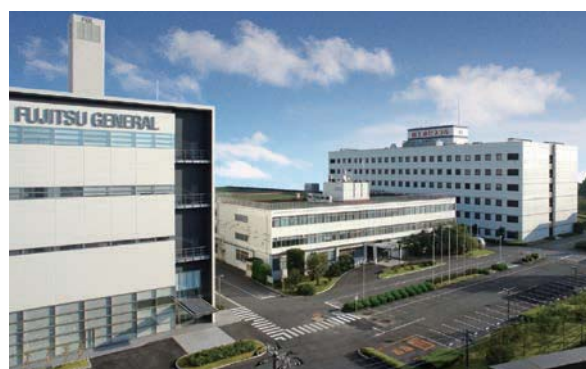
● 本社 : Head Office